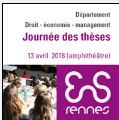
Journée des thèses en droit - économie - management