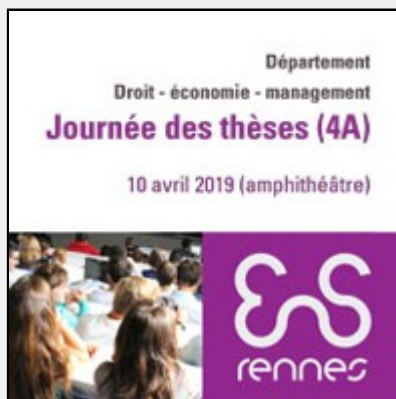
Journée des thèses en droit - économie - management