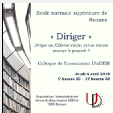
Colloque UbiDEM : Diriger