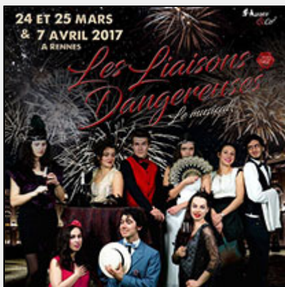
"Les Liaisons Dangereuses" de Muses & Co