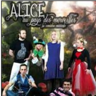
"Alice au pays des merveilles" de Muses & Co