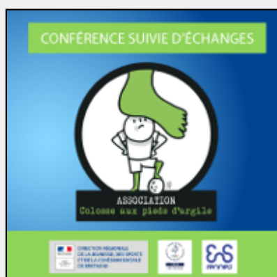
Prévenir les violences sexuelles dans le sport en Bretagne