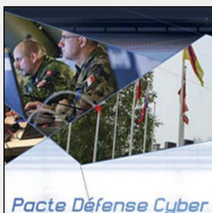
Pacte Défense Cyber Pôle d'Excellence Cyber (PEC)