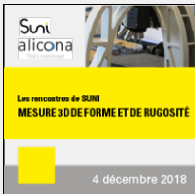
Mesure 3D optique de forme et de rugosité