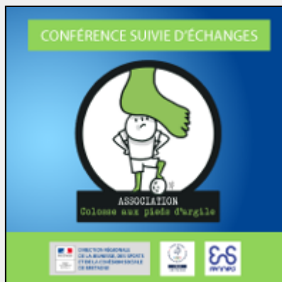
Prévenir les violences sexuelles dans le sport en Bretagne