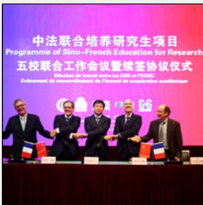
Renouvellement des accords PROSFER